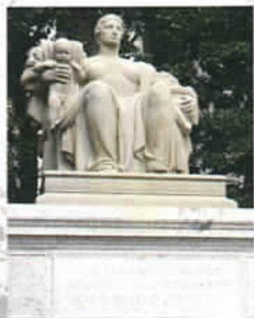
過去の遺産は将来の実りをもたらす種である